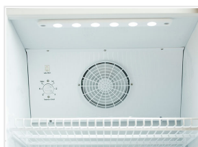
Ventilatore interno di assistenza