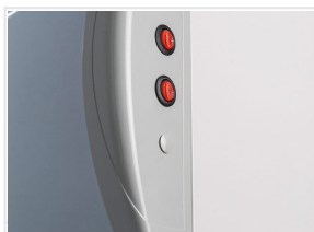
Interuttori indipendenti per le luci interni e per l'opalina