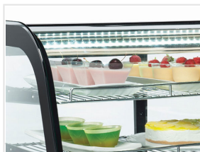
Luce LED interna