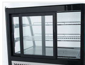
Porte scorrevoli posteriori