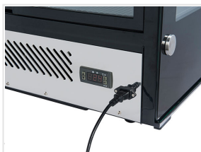
Basamento in acciaio inox con controllore digitale