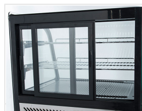
Porte scorrevoli posteriori