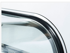
Vetri laterali e frontale curvi