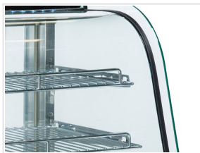
Doppio vetro anti-dispersione