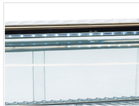
Luce LED interna