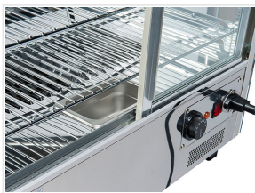
Basamento in acciaio inox